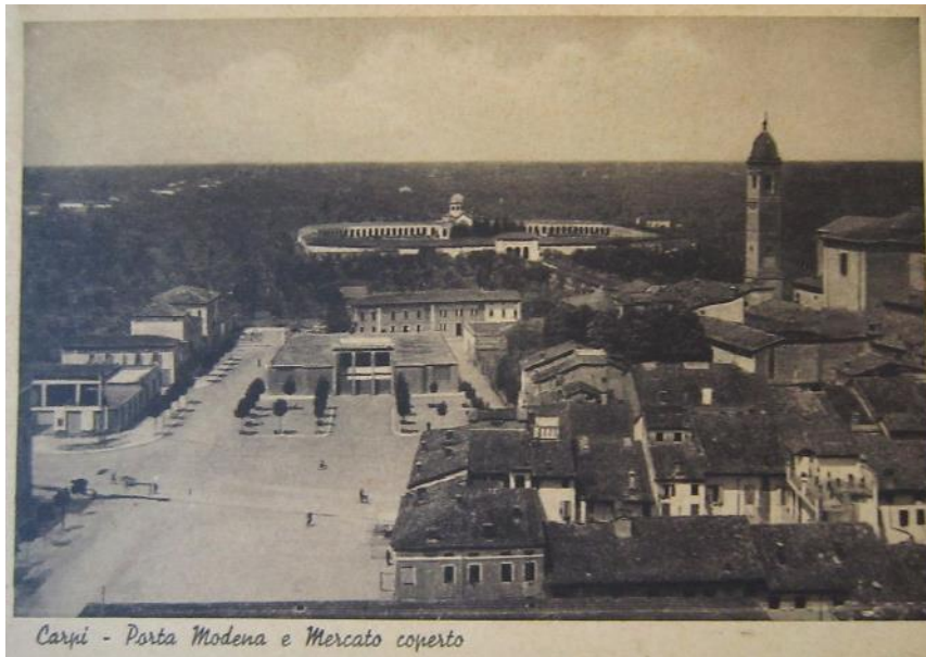
Figura 4 - immagine d'archivio anno 1939