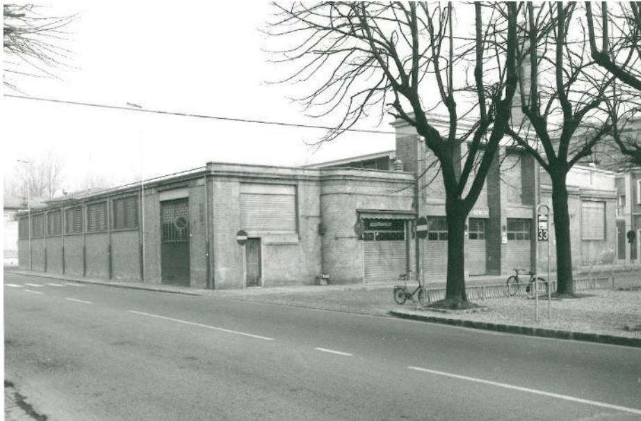
Figura 6 - immagine d'archivio anno 1982