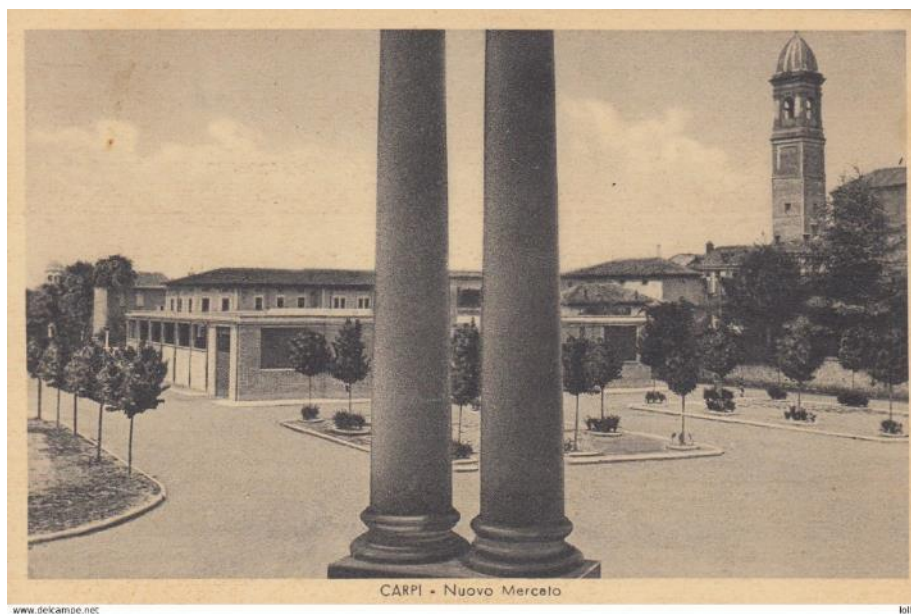
Figura 5 - immagine d'archivio anno 1940