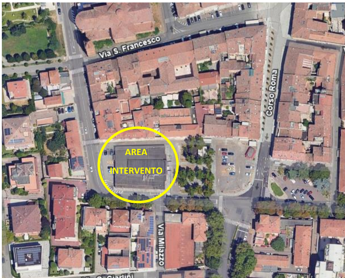
Figura 1 Inquadramento area d'intervento

L'area, pertanto, non necessita di alcuna modifica significativa alla viabilità esistente poiché risulta già servita dalla viabilità principale e da adeguati percorsi ciclabili e pedonali che la collegano con i principali punti di interesse della città e del territorio.